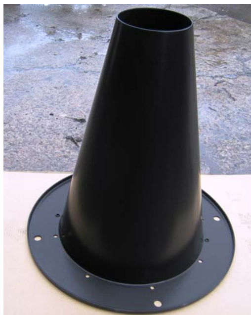
Stålskørt belagt med Accoshield

Belægningen er forholdsvis blød og kan beskadiges af skarpe værktøjer el. lign. Vi anbefaler at de medarbejdere der arbejder med emner belagt med Accoshield informeres om dette og at de anvender værktøj som ikke beskadiger belægningen f.eks. gummispartler.