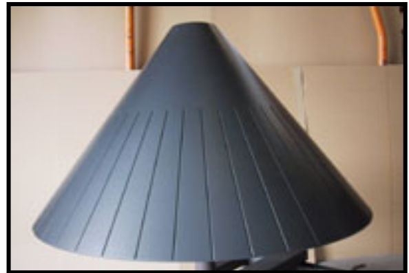
Konus belagt med Accoflon H

Accoflon H er en de senere års største nyheder p.g.a. sin fremragende slidstyrke. Slidstyrken har tidligere, for andre belægnings, været et problem, som har medført kort levetid og dermed forøgede omkostninger og ekstra arbejde. Det er nu med Accoflon H fortid. Belægningen anvendes derfor, hvor man ønsker god slidbestandighed kombineret med de sædvanlige Teflon® egenskaber for fluorcarbonbelægnings, nemlig non-stick eller lav friktions egenskaber. Anvendelserne er mangfoldige: F.eks. plastsvejs udstyr, udstyr til fødevarerproduktion, udstyr til emne transport.