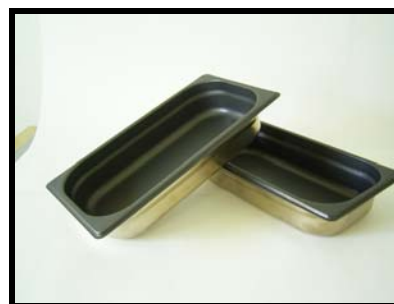
Kantiner belagt med Accoflon 2C

Dette datablad er også gældende for Accoflon P348, som er en sort udgave af Accoflon 2C